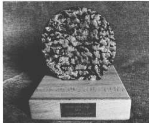
Premi Pedra Seca 2021, 2022 i 2023.

(2018) i les construccions d'abastament d'aigua de Torrebesses (2019).