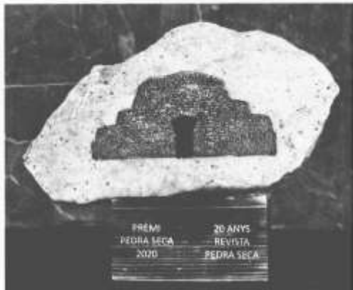
Premi Pedra Seca 2020.