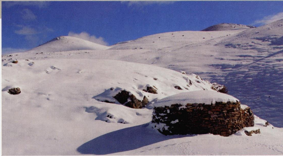
La barraca del Clot de la Fou, al terme de Toses (Ripollès).

medieval amb ocupacions posteriors que ens fan variar la nostra idea sobre l'ocupació de l'alta muntanya. Per tant, la muntanya, lluny del que ens pot semblar actualment, no és un espai verge. En tot cas és un espai que ha quedat fora de l'activitat humana actual que ha passat a ser, bàsicament, del sector de serveis.