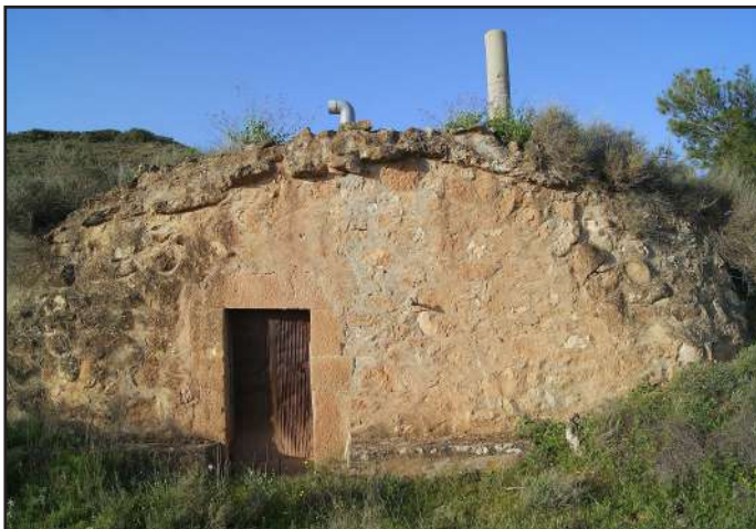
6 (X: 316607 Y: 4596028, codi W_17609)