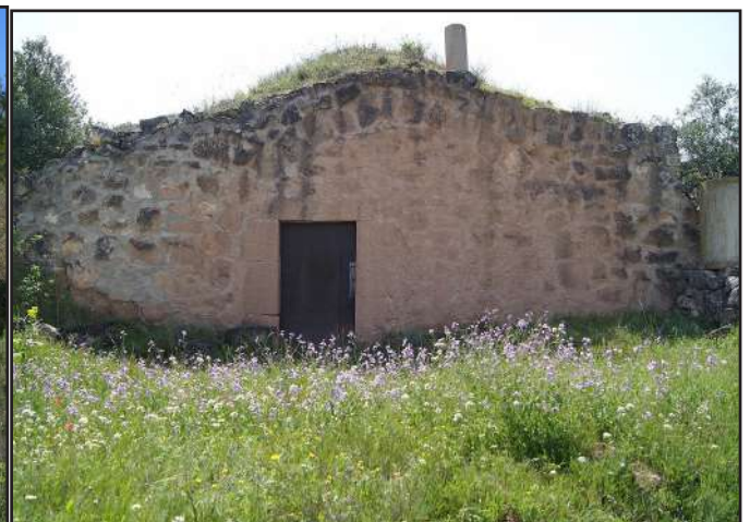
7 (X: 316930 Y: 4595953, codi W_17615)