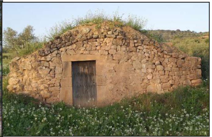
5 (X: 315846 Y: 4596244, codi W_17608)