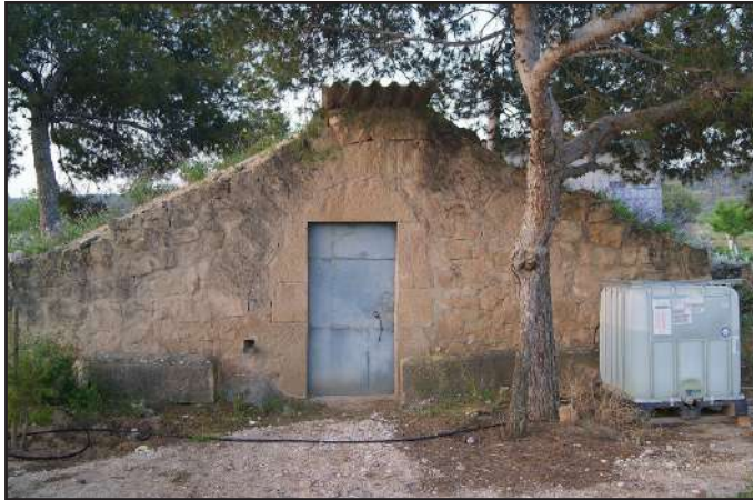
4 (X: 315698 Y: 4596720, codi W_17607)