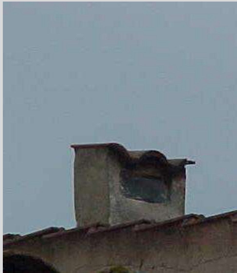
Vilallonga de ter