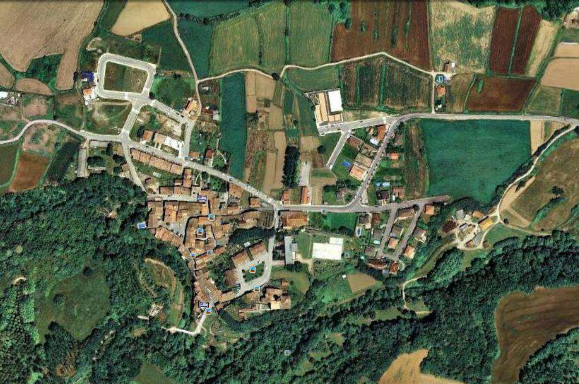
arran de riu