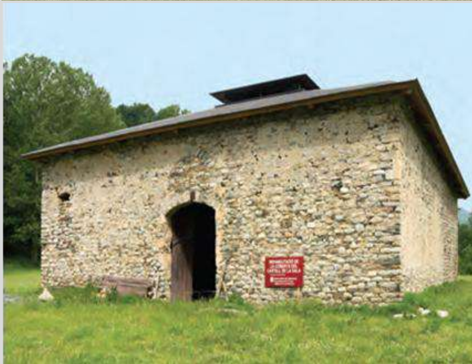
Vilallonga de Ter