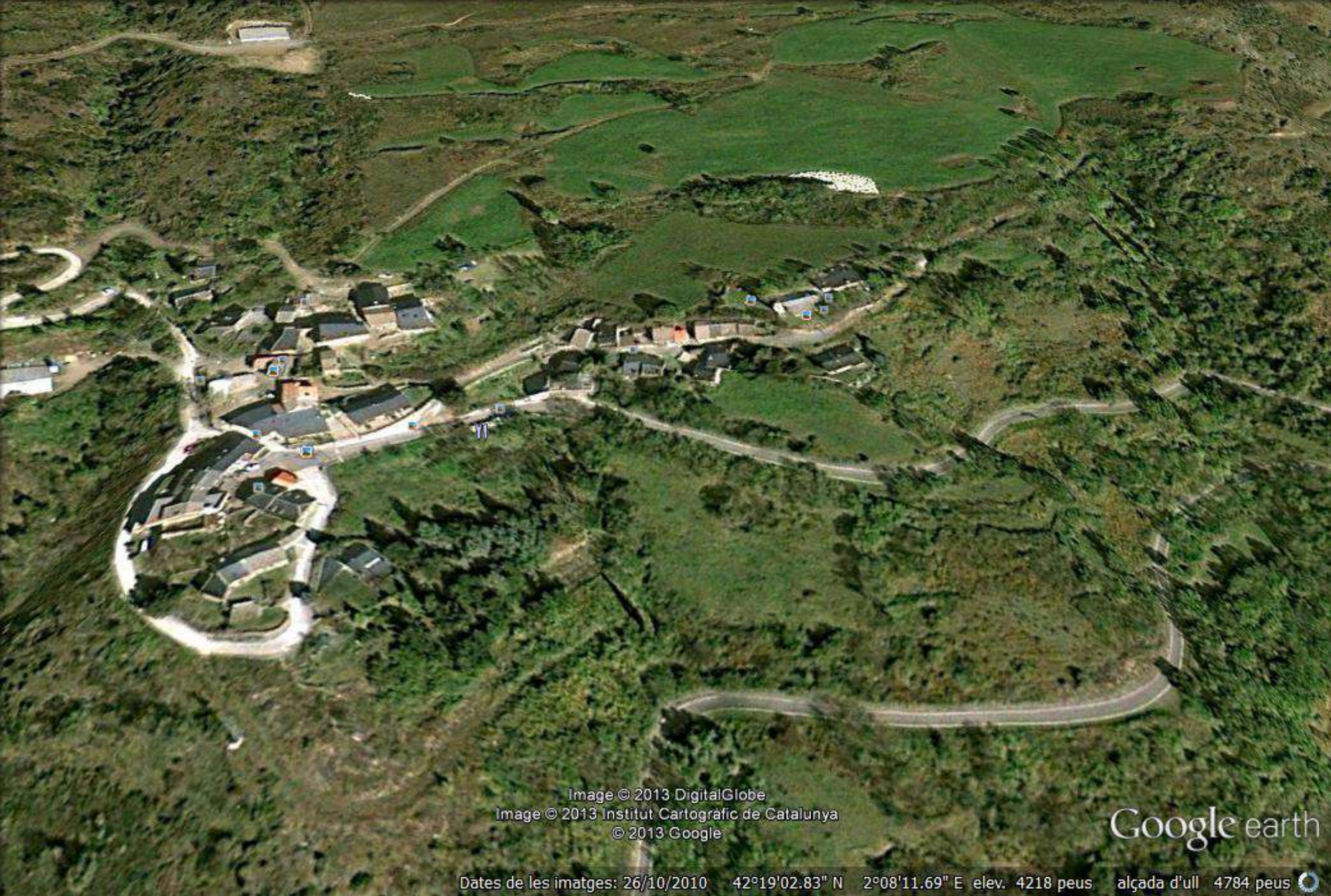
Image © 2013 DigitalGlobe Image © 2013 Institut Cartogràfic de Catalunya © 2013 Google