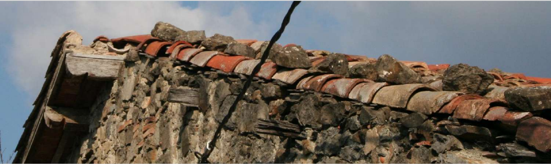
Santa Maria de Besora