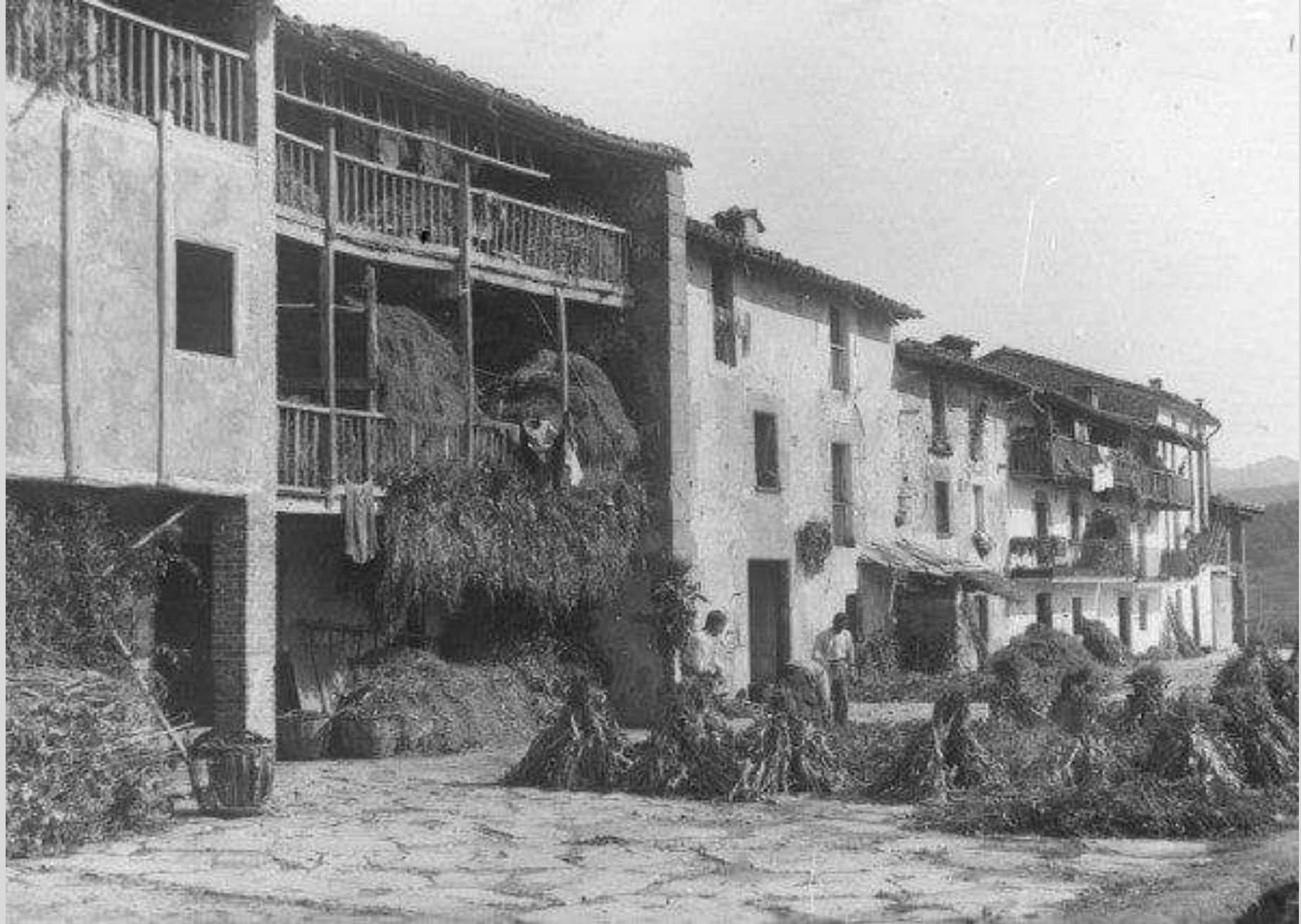
Hostalets d'en Bas