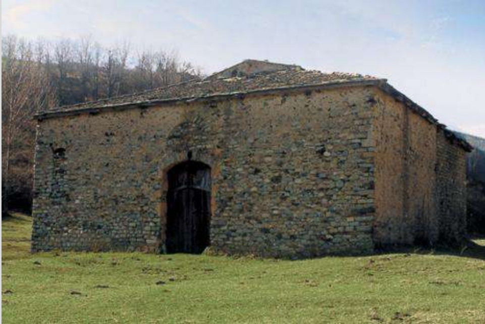
Castell de la Sala