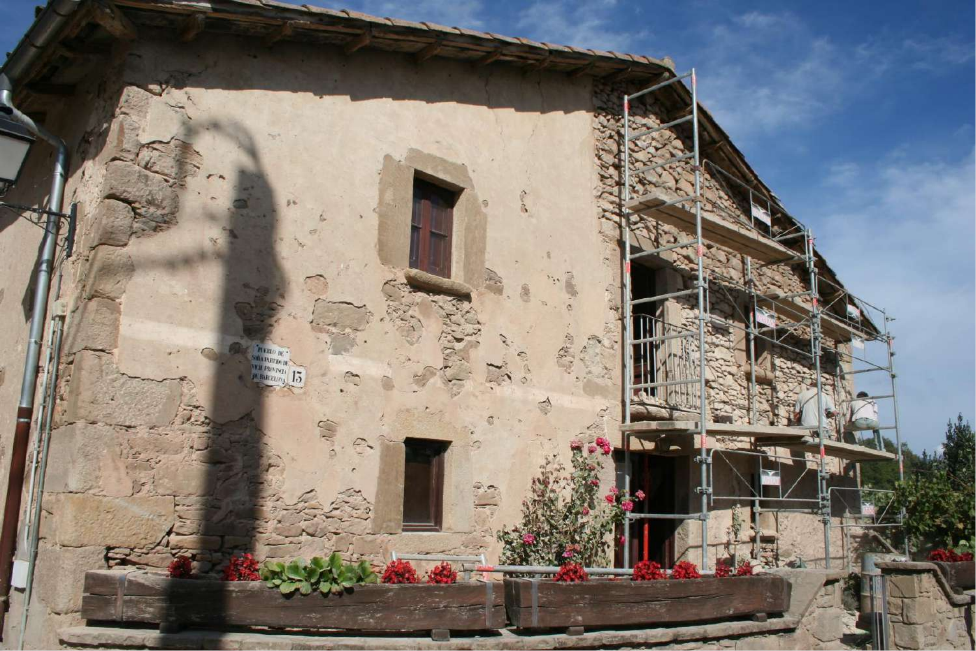
Hostalets d'en Bas