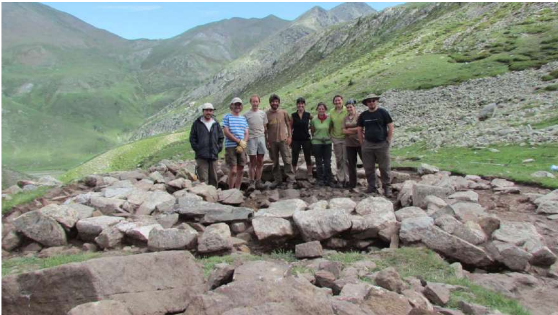
Excavació barraca coma de Vaca (Núria).