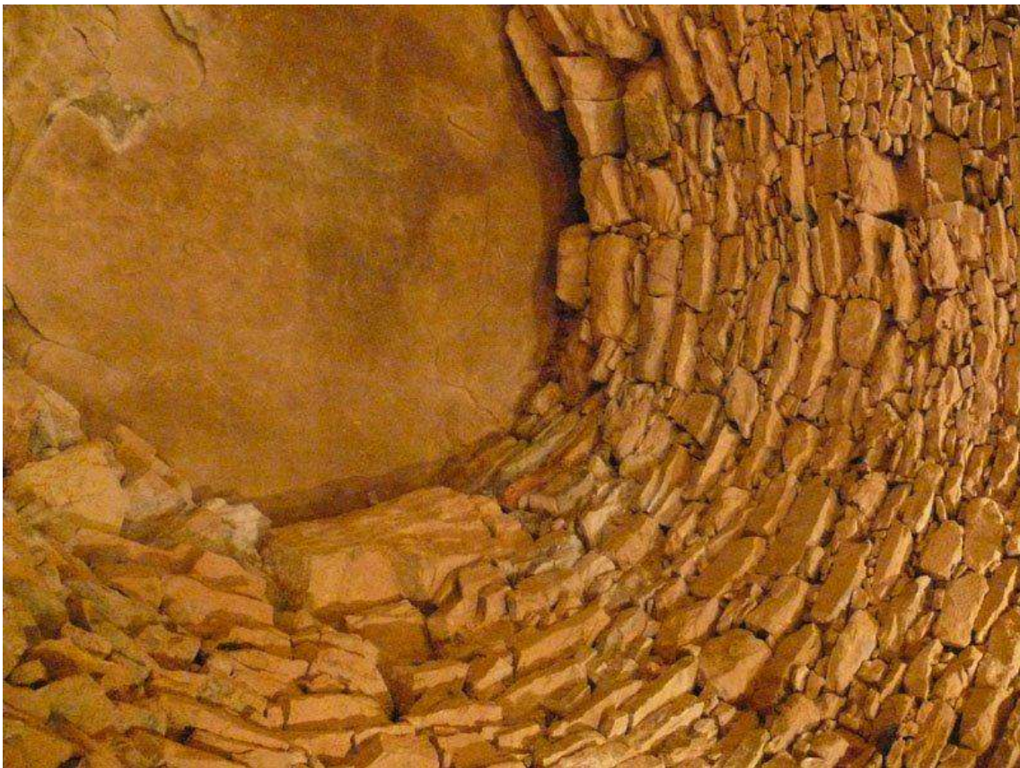
Falsa cúpula. Dolmen Romeral (Antequera)