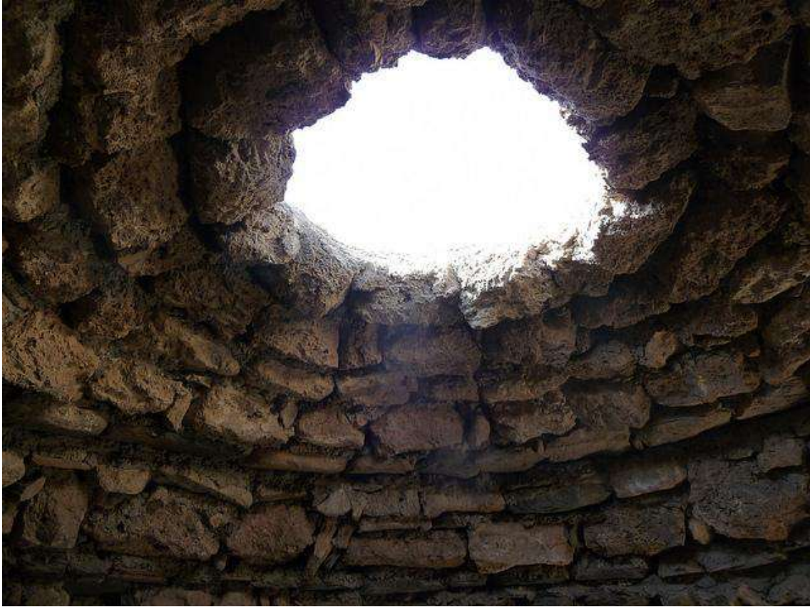
Falsa cúpula (Millars – Almeria). Edat Bronze