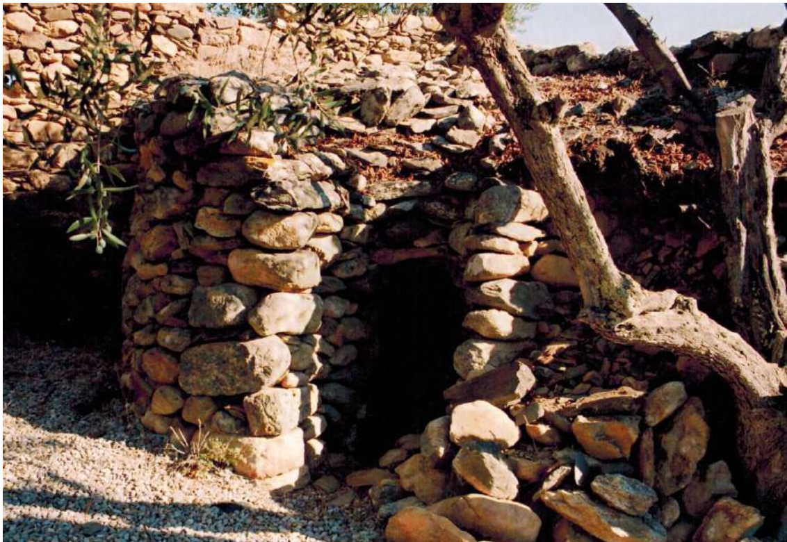
Cabana de pastor (L'Albera).