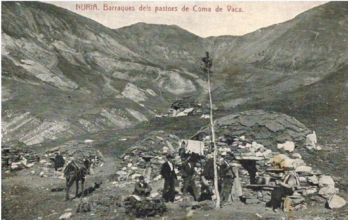
Barraca de coma de Vaca (Núria)