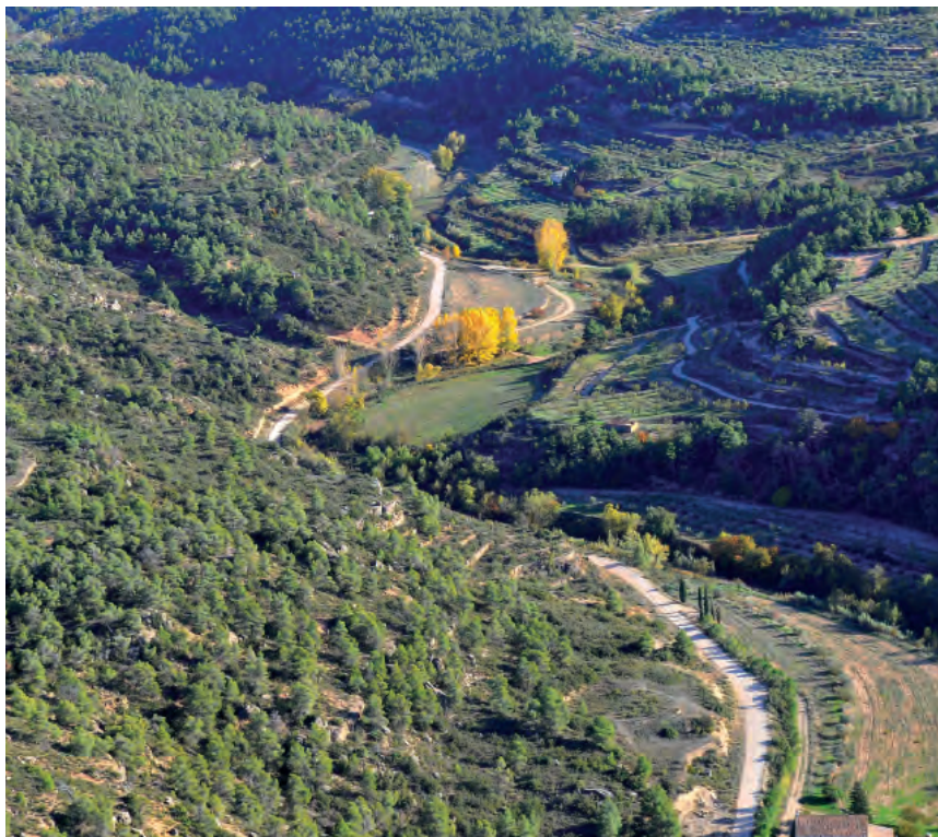
Tram del riu de Set i pas dels traginers del camí ral. En primer terme es veu parcialment l'hostal del Marc. Aquest espai quedarà inundat properament per l'embassament de l'Albagès (J. M. Rué)