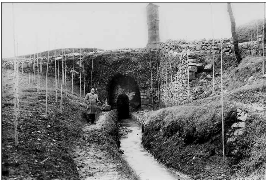
Boca nord de la mina, sota l'ull del Pontarró, cobert de vegetació, en una imatge de cap al final de la dècada de 1940. Damunt el pont s'alça el pedró.

es plantejà de resoldre amb una solució provisional (que no ha quedat aclarida), a causa de l'escassetat de recursos econòmics disponibles. 40