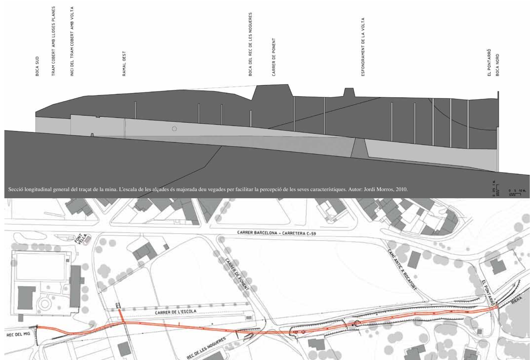
Secció longitudinal general del traçat de la mina. L'escala de les alçades és majorada deu vegades per facilitar la percepció de les seves característiques. Autor: Jordi Morros, 2010.

Finalment, és interessant mencionar que en els trams inspeccionats de la mina s'han observat diverses reparacions puntuals històriques, amb obra de maó ceràmic massís i morter; i fins i tot un tram de vora 3 m de longitud cobert amb volta de maó de pla.