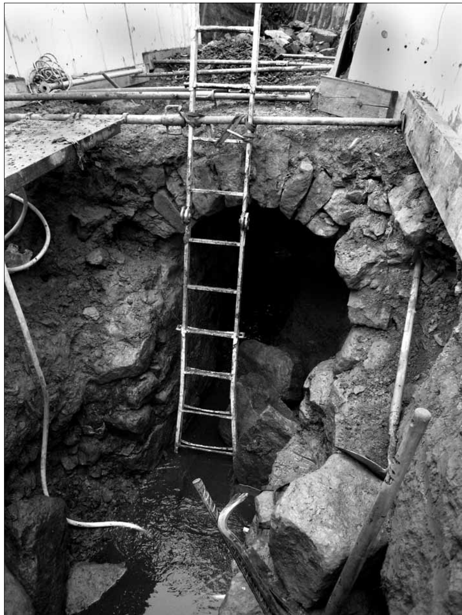
Treballs de desenrunament d'un tram esfondrat de la mina.