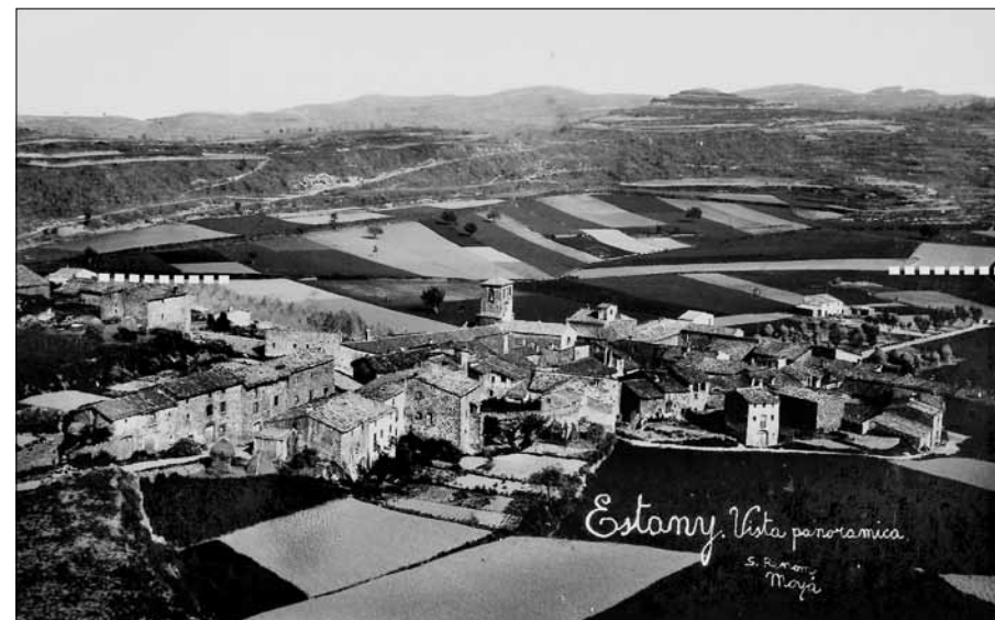
El poble de l'Estany vers el 1920. S'indica amb una línia discontinua blanca els extrems del traçat de la mina de desguàs del prat.

carenes de la Serreta, el turó de la Barra, el serrat de l'Horabona, el collet del Raval del Prat, el serrat Febrer, el serrat de la Creu, el serrat del Gaig i les mateixes boques receptores de la mina (en la delimitació d'aquesta àrea de drenatge no s'ha considerat els sòls urbanitzats propers, que compten amb un sistema de recollida d'aigües pluvials canalitzades, a través de la xarxa de clavegueram municipal).