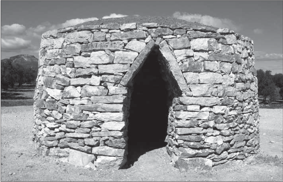
Barraca de nova construcció (març del 2006) feta a la rotonda de l'encreuament de la T-323 (carretera de la mar), la urbanització Club Mont-roig i el camí de les Arenes.