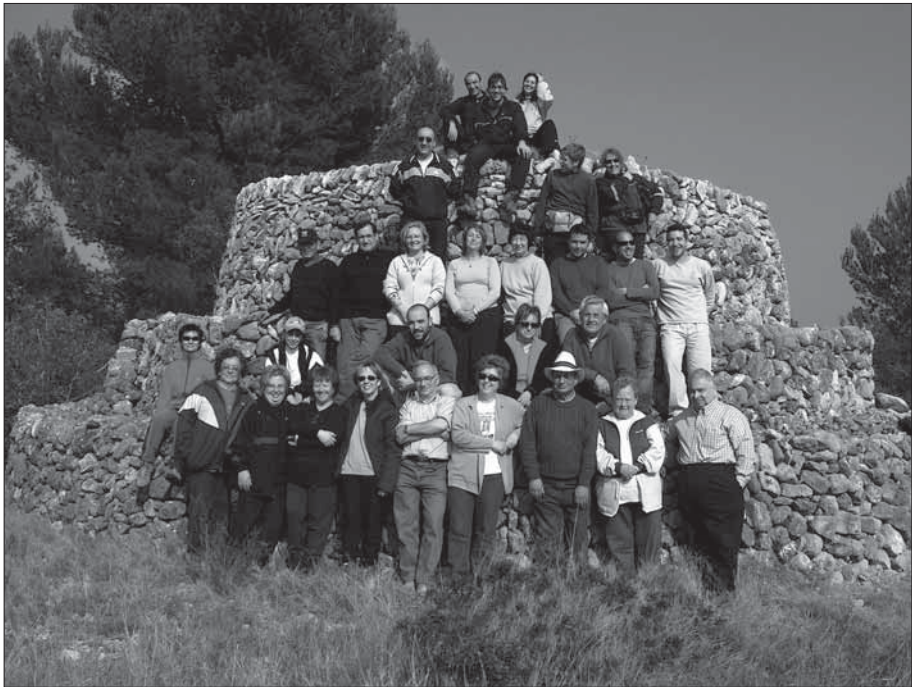
Excursió popular de l'Associació de Veïns Muntanya Roja (23 de març del 2005).

Aquest itinerari el vàrem inaugurar amb una excursió popular de l'Associació de Veïns Muntanya Roja (23 de març del 2005), en la qual van participar unes quaranta persones ( Ressò Mont-roigenc , núm. 94, 2n trimestre 2005).