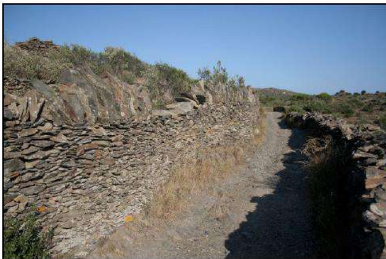
Camí de Puig Ferral

tema de murs de contenció de la terra hauria estat arrossegat per les pluges —donada la brusquedat de l'orografia— si no s'hagués dotat el paisatge d'un complicat sistema de desguassos en pedra i dels corresponents camins. En tota la nostra costa hi ha gran quantitat d'aquestes parets, però Cadaqués és l'essència mateixa de la civilització de les parets seques.