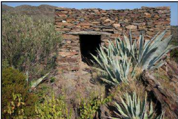
Barraca de pedra seca prop de mas Duran

Cent cinquanta, cent anys enrere, la major part d'aquestes platafor-